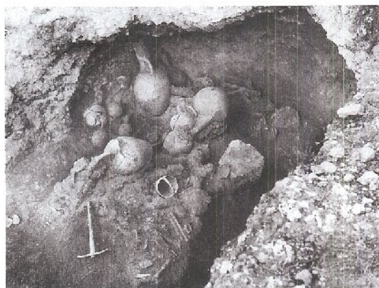
Εικ. 2. Δεκέμβρης 1942: Το βορειοανατολικό τμήμα του Τάφου 1 της Φιλιάς.

ματα της Φιλιάς αντιπροσώπευαν ένα μέχρι τότε άγνωστο πολιτιστικό στάδιο, μεταγενέστερο από τη Χαλκολιθική περίοδο και προιμότερο από τα μέχρι τότε γνωστά ευρήματα της Πρώιμης Εποχής του Χαλκού. Έχοντας