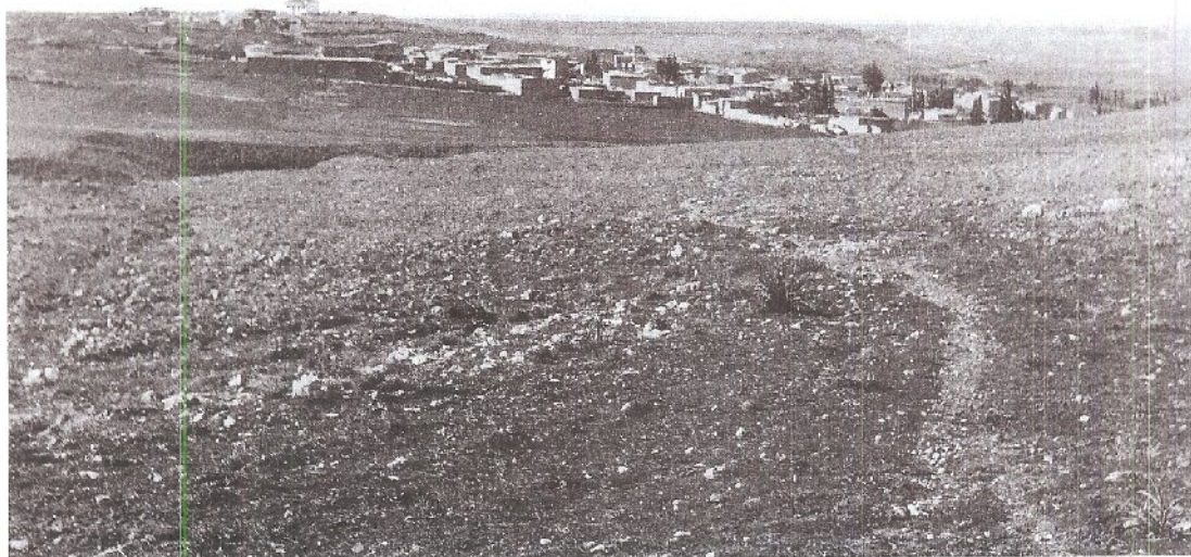
Εικ. 1. Το χωριό της Φιλιάς τον Γενάρη του 1943.

οείου, είχε εφαρμόσει ένα τεράστιο ερευνητικό πρόγραμμα, με το οποίο έθεσε τη μελέτη της κυπριακής προϊστορίας σε εντελώς νέες βάσεις. Εντόπισε και ανέσκαψε τις θύσεις της Χοιροκοιτίας, της Σωτήρας και της Ερήμης, που θεμελίωσαν την έρευνα της Νεολιθικής και Χαλκολιθικής περιόδου (Δίκαιος 1936, 1953). Παράλληλα, στα 1931-32, εντόπισε και ανέσκαψε ένα νεκροταφείο της Πρώιμης Εποχής του Χαλκού στους Βουνούς του Πέλαπαϊς (Δίκαιος 1940). Το νεκροταφείο αυτό είχε δώσει για πρώτη φορά μια εντυπωσιακή εικόνα για την Πρώιμη Εποχή του Χαλκού στην Κύπρο. Η χαρούμενη διάθεση στην τέχνη αυτής της περιόδου γινόταν για πρώτη φορά γνωστή, ενώ ο χαρακτήρας μερικών έργων τέχνης φώτιζε για πρώτη φορά τις σύνθετες δομές της κοινωνίας που τα δημιούργησε.